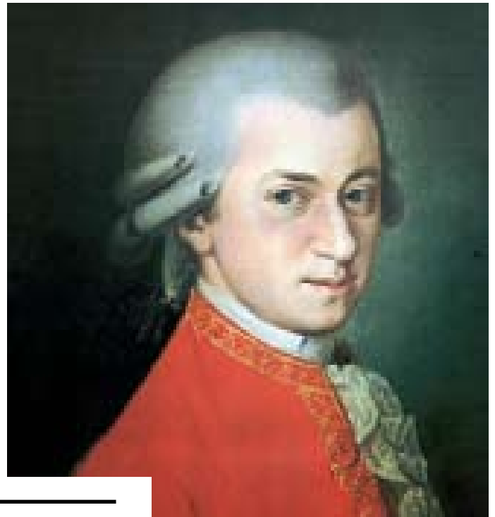
וולפגנג אהדאוס מוצרט ולודוויג ואן־בטהובן. בתי קפה עברו להשמיע מוסיקה קלאסית בה אין זכויות