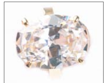
סכסוך בין חברות יהלומים הועבר לבוררות

על יסוד סעיף 29 לחוק הבוררות מוסמך בית המשפט לקבוע, כי הפקדת ערובה לביצוע פסק בוררות היא תנאי לדיון בבקשה לביטול הפסק. התערבות ביהמ"ש בפסק בוררות היא מצומצמת. על המבקש את ביטולו להראות, כי סיכויי הצלחתו לביטול הפסק גבוהים או כי מאזן הנוחות נוטה לצידו משמעונית. (רעא 7592/08, פ.ד. די.הלומים בע"מ נ' I.D.O.Dia- (monds Inc).