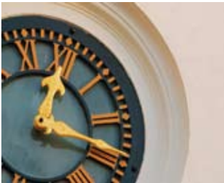
הלקוח יחויב בהוצאת על בקשות טורדניות

לחיוב הלקוח בהוצאות. (בשא קריות) 3293/08 א.ב. נ' א.ש).