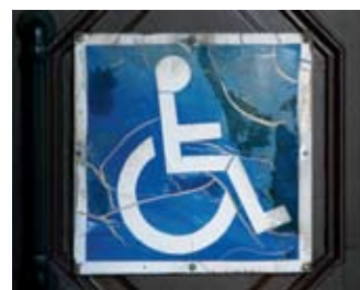
ההוצאה לפועל יכולה לעקל רכבו של נכה

הסייג בדבר הטלת עיקול הקבוע בסעיף 22 (א)(5) לחוק הוצל"פ חל גם לגבי רכב של נכה. ודוק, הנכה שהוא חייב בהוצל"פ אינו בר חורין להחזיק בכל מיטלטלין שיח"פ, אלא רק אלה הנחוצים לשימוש האישי בשל מצבו. בבקשת המבקש להסרת העיקול חסרים פרטים בדבר הרכב ועלותו. (ברע ב'ש) 510/08 גור יהודה נ' בנק המזרחי המאוחד בע"מ).