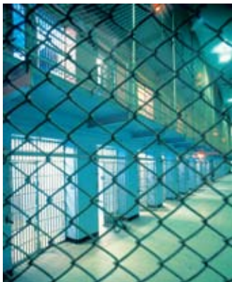
מאסר על תנאי יהיה מצטבר לעונש החדש

כלל הוא, כי מאסר מותנה ירוצה באופן מצטבר לעונש החדש, למעט במקרים חריגים, כאשר על בימ"ש לנמק את הטעם לחריגה מכלל זה. לפיכך, המשיב ירצה עונש מאסר מותנה שהיה תלוי ועומד נגדו במור- עד הרשעתו הנוכחית, במצטבר לעונש שהוטל עליו על ידי בימ"ש קמא. (עפ 1323/08 מדינת ישראל נ' פלוני).