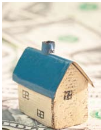
רישום תוך שימוש בייפוי כוח שאינו מסוים

ביהמ"ש קיבל תביעה לזכויות במ"קרקעין, הרשומים על שם הנתבע, על אף שזו התבססה על מסמך ייפוי כוח שאינו מסוים, אינו מאומת ע"י עו"ד ונוטריון והעיסקה לא דווחה כדין למנהל מיסוי מקרקעין. (תמש (י-ם) 10470/05 ס' י' נ' ס' ד').