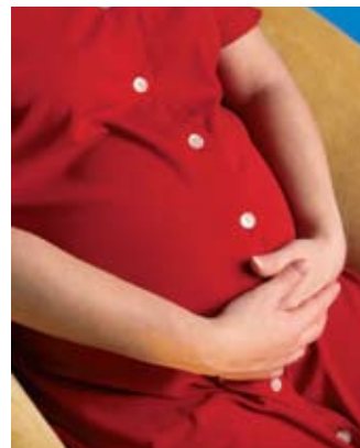
חופשה ללא הגבלת זמן לאחר חופשת לידה

ביה"ד לעבודה דחה את תביעת התובע לבטל את החלטת הממונה על השכר לחדול לשלם לו תוספות שכר ולתבוע ממנו השבת הפר- שי השכר ששולמו לו שלא כדין, מהטעם שתוספות אלה שולמו לו בניגוד לחוק. לפיכך, ביה"ד קיבל את תביעת הוועדה לתכנון ובנייה להשבת השכר ששולם ביתר. (עב חי') 419/05 נג'יב אבו סמרה נ' הוועדה המרחבית לתכנון ובנייה גבעות אלונים).