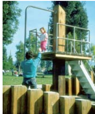
האב ישתתף בהסעות הסדרי הראייה

ביהמ"ש דחה טענת אם בעניין תביעתה למשמורת בשל מעברו של האב והקטינים למקום מגור"רים מרוחק ממנה. אין במעבר כדי למנוע את הקשר בינה ובין הקטי"נים והשינוי במשמורת אינו עולה בקנה אחד עם טובת הקטינים. עם זאת, האב חויב להשתתף בהס"עות הסדרי הראייה. (תמש (ת"א)