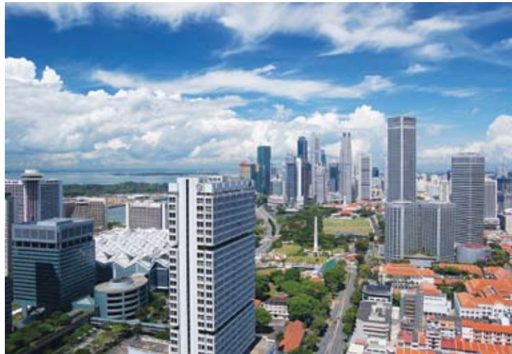
סינגפור ביקשה ללמוד מישראל, עד שהקימה רשות פיתוח אחת

חוק הפרויקטים הלאומיים יביא לייבוש הביצה הבירוקרטית בה שקעו הפרויקטים הגדולים של התשתיות ויצעיד את ישראל למקום הראוי לה בתום העשור הראשון של המאה ה-21. סינגפור – כאן ועכשיו! ///